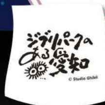
限定ハンドタオル等

2024 10/3 木 - 4 金 10:00-17:00 10:00-16:00